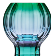
váza / Zambra alexandrit podjímáný zelenou podstavec: oceanit 17 × 26,8 cm 3458