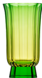
váza / Mambo eldor podjímáný zelenou podstavec: oceanit 19 × 33,5 cm 3457