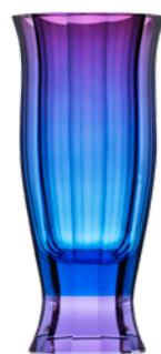
váza / Fandango akvamarín podjímáný růžovou podstavec: alexandrit 17 × 36 cm 3454

Vázy nesou názvy latinskoamerických tanců, jejichž rytmus se odráží v barevných odstínech a jejich přechodech i v broušených hranách. Nechte se vtáhnout do ohnivého španělského fandanga, národního tance Dominikánské republiky merengue, paso doble oslavujícího vítězného toreadora, kubánského mamba a v poslední řadě andaluské zambry, která je tradiční variantou proslulého flamenca.