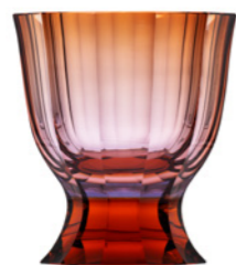
váza / Paso doble alexandrit podjímáný aurorou podstavec: topas 25,5 × 27,3 cm 3456