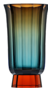
váza / Mambo akvamarín podjímáný aurorou podstavec: topas 19 × 33,5 cm 3457