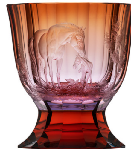
váza / Paso doble ryt. Koně alexandrit podjímáný aurorou podstavec: topas 25,5 x 27,3 cm 3456 limitovaná série / 30 ks