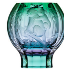
váza / Zambra ryt. Koaly alexandrit podjímaný zelenou podstavec: oceanit 17 × 26,8 cm 3458 limitovaná série / 30 ks