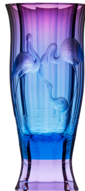
váza / Fandango ryt. Plameňáci akvamarín podjímáný růžovou podstavec: alexandrit 17 x 36 cm 3454 limitovaná série / 30 ks

Pro novou kolekci motivů ze života fauny jsme zvolili emoce. V roce 2020 zažil celý svět velmi neočekávanou situaci, která převrátila životy mnohých z nás naruby. Chceme na to reagovat pozitivní emocí, emocí vztahu, emocí rodiny. Proto jsme zvolili generační vzájemnost mláděte a matky nebo mláděte a otce, která symbolizuje vztahy nás všech.