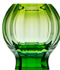
váza / Zambra beryl podjímáný resedou podstavec: oceanit 17 × 26,8 cm 3458