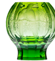
váza / Zambra ryt. Papoušci beryl podjímaný resedou podstavec: oceanit 17 × 26,8 cm 3458 limitovaná série / 30 ks