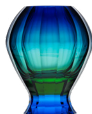
váza / Merenga oceanit podjímáný modrou podstavec: akvamarín 12,9 × 25,4 cm 3455