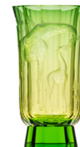
váza / Mambo ryt. Žirafy eldor podjímaný zelenou podstavec: oceanit 19 × 33,5 cm 3457 limitovaná série / 30 ks