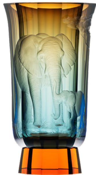
váza / Mambo ryt. Sloni akvamarín podjímáný aurou podstavec: topas 19 x 33,5 cm 3457 limitovaná série / 30 ks

Plastičnost výjevů a jejich atmosféru umocňuje náročná technika podjímání. Zatímco topas evokuje horkou africkou savanu, akvamarín nás vtáhne přímo do mořských hlubin za dovádějící rodinou mořských želv, jejichž oblá těla kopírují zakulacený tvar vázy. Protáhlé nohy a choboty slonů se naopak prolínají s broušenými hranami vysoké vázy.