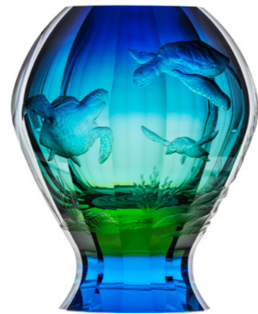
váza / Merenga ryt. Želvy oceanit podjímáný modrou podstavec: akvamarín 12,9 x 25,4 cm 3455 limitovaná série / 30 ks