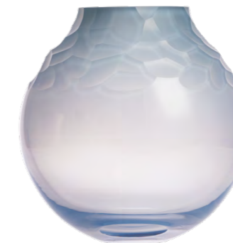
váza opál fialový broušené kameny 12,2 × 25 cm 3498