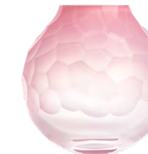
váza opál růžový broušené kameny 7,3 × 15 cm 3498