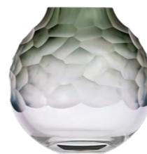
váza kouřově zelená broušené kameny 7,3 × 15 cm 3498

„Vzpomněl jsem si na růžovo–lososový kámen, který jsem měl ve své dětské sbírce. Byl odštípnutý, hladký a zároveň matně sametový. A právě to jsem chtěl do vázy otisknout,“ říká designér a umělecký ředitel Moseru Jan Plecháč.