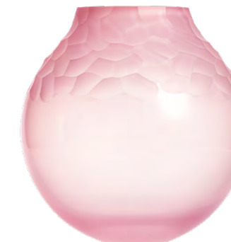
váza opál růžový broušené kameny 12,2 × 25 cm 3498