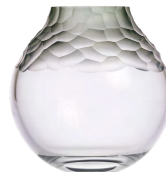
váza kouřově zelená broušené kameny 12,2 × 25 cm 3498