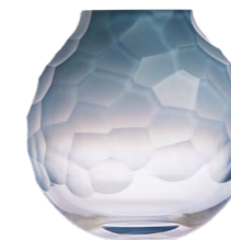
váza opál fialový broušené kameny 7,3 × 15 cm 3498