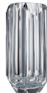
křišťál 16,5 × 33 cm 03506