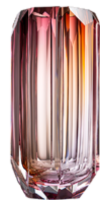
aurora, ametyst, růžová tříbarevné jádro 16,5 × 33 cm 03506

Každá váza Era je signována svými tvůrci – rytířem Řádu umění a literatury Zdeňkem Drobným a designérem a uměleckým ředitelem Moseru Janem Plecháčem.