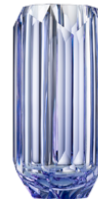
alexandrit vrstvený křišťál 16,5 × 33 cm 03506