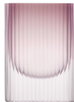
opál růžový matný brus 19,5 × 27 cm 03489