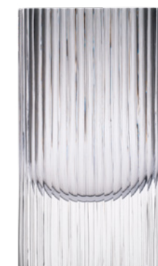
kouřově zelená leštěný brus 18 × 30 cm 03490