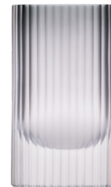
kouřově zelená matný brus 18 × 30 cm 03490