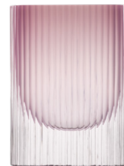
opál růžový leštěný brus 19,5 × 27 cm 03489